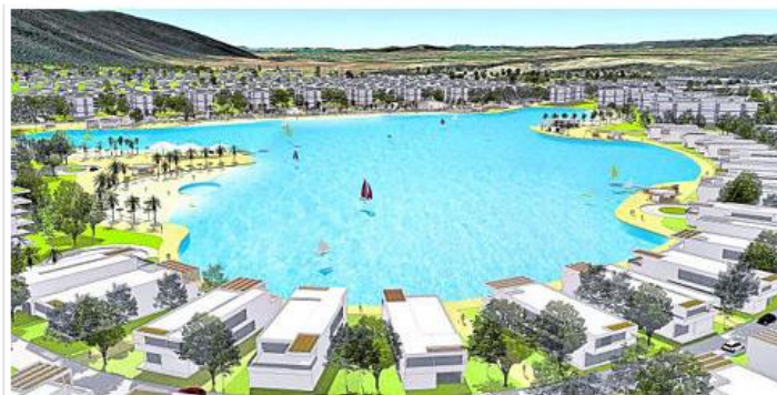
Playas en las ciudades